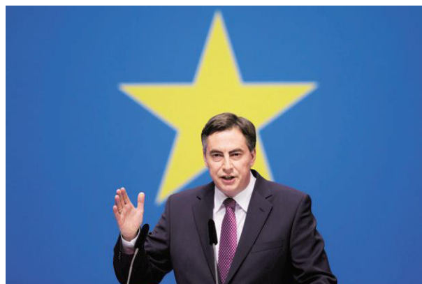
Foto: Dejvid Mekalister, Izvestilac Evropskog parlamenta za Srbiju

Rezolucija o Izveštaju o napretku Srbije iznosi opštu ocenu stanja u Republici Srbiji. Zatim se osvrće na političke kriterijume i njihovo sprovođenje u periodu izveštavanja. Takođe, Rezolucija tretira ekonomska pitanja i regionalnu saradnju.